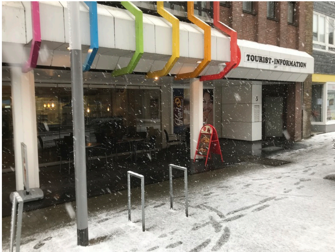
Touristeninformation Eingang Steinstraße.