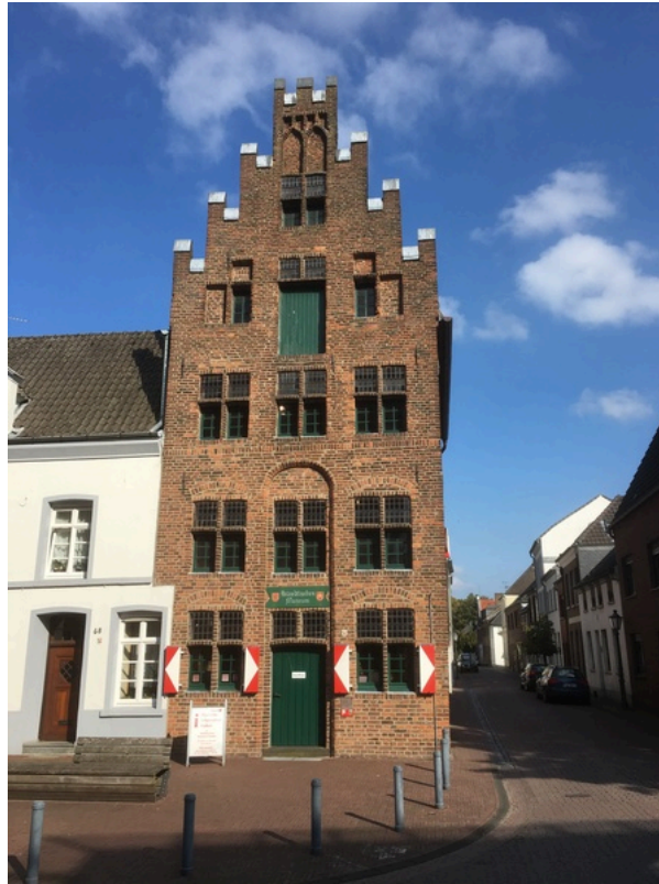
Tourist-Information Kalkar im Städtischen Museum