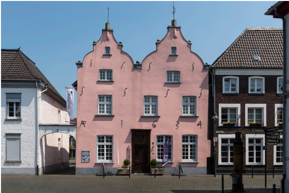
Naturparkzentrum Wachtendonk Haus Püllen