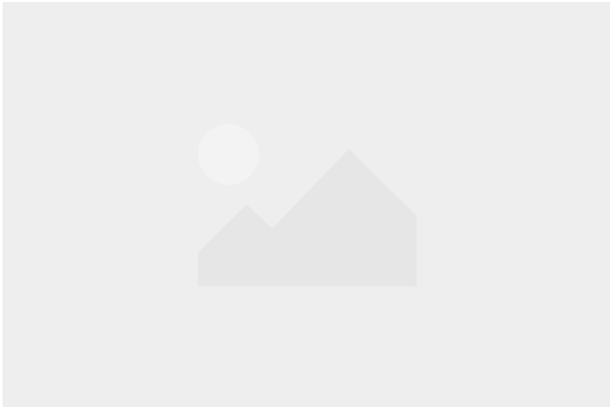
Hafen Vynen Pier 5